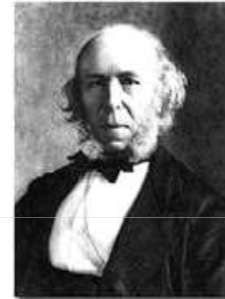
Herbert SPENCER (1820 - 1903)