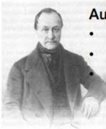
Auguste COMTE (1798 - 1857)